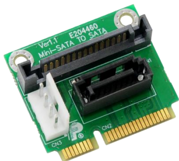
PMMD V1.1 (SATA 電源付ハーフサイズ mSATA-SATA アダプタ) x1