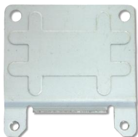
Metal Baffle x1 (ハーフ-フルサイズ変換ブラケット) x1